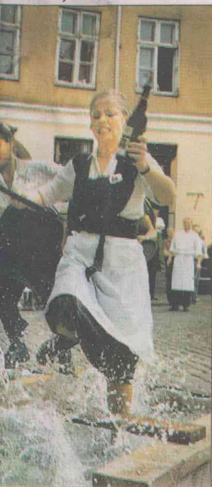
Ravnsløb fra restaurant Peder Oxe i København. En tjener løber hårdt ud over servicet i årets tjenerløb.